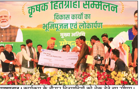
शमशाबाद। कार्यक्रम के दौरान हितग्राहियों को चेक देते हुए सीएम।