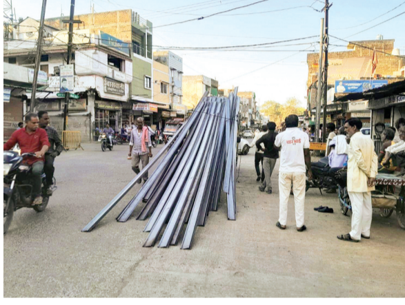
हरिभूमि न्यूज ► गंजबासोदा

शनिवार को शाम के समय त्योंदा रोड पर एक लोडिंग चार पहिया वाहन जिसमें लोहे के गाडर रखे हुए थे, पीछे से उठ गया। वाहन में क्षमता से अधिक वजन के गाडर भरे थे और वाहन के ब्रेक लगाते ही गाडर आगे खिसक गए जिसके बाद लोडिंग पर पूरा वजन आगे की ओर