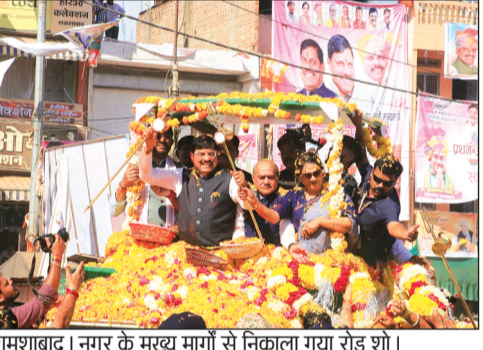
शमशाबाद। नगर के मुख्य मांगों से निकाला गया रोड शो।