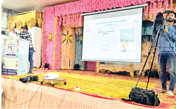
हरिभूमि न्यूज ► गंजबासोदा